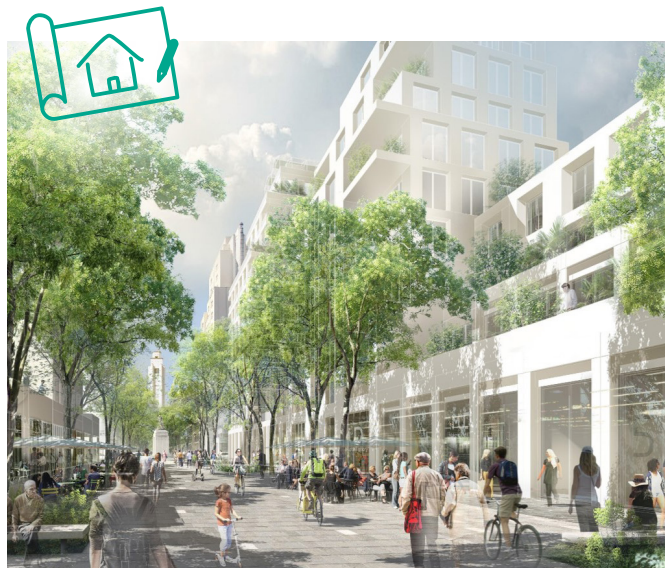
▲ L'avenue Henri-Barbusse prolongée

DEUX DES PRINCIPAUX AXES DU QUARTIER, L'AVENUE HENRI-BARBUSSE ET L'ESPLANADE AGNÈS-VARDA, SERONT ENTIÈREMENT PIÉTONS.