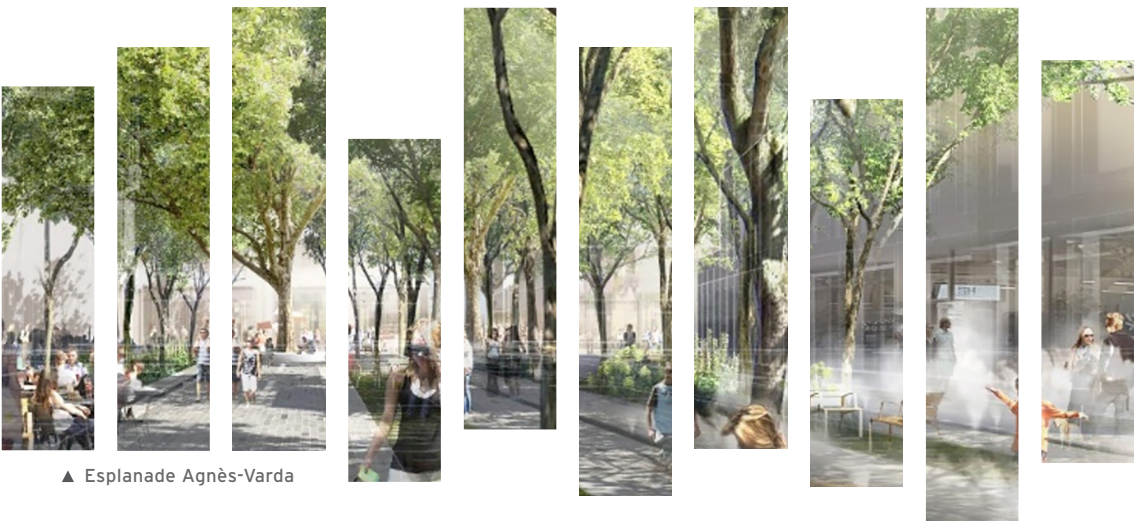
▲ Esplanade Agnès-Varda