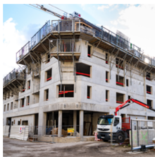
▲ Lycée Pierre-Brossolette chantier en mars 2020 Maitrise d'ouvrage : Région AURA Architecte : Atelier Nicolas Michelin & Associés (ANMA)