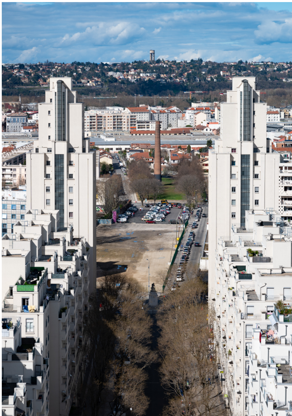
▲ La future avenue Henri-Barbusse prolongée

Jonction entre l'existant et le projet, cette avenue symbolise la colonne vertébrale du centre-ville de Villeurbanne.