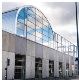
▲ Complexe sportif Alexandra David-Neel 100 rue Francis de Pressensé Architecte : ANMA

Une toiture en dôme remarquable, un mur d'escalade spectaculaire, une salle de danse lumineuse et un terrain de basket sur le toit, ... aucun doute, vous êtes dans le complexe sportif Alexandra David-Neel. Il proposera bien d'autres disciplines et complètera l'offre sportive du quartier.