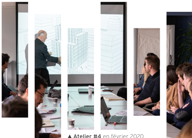
▲ Atelier #4 en février 2020