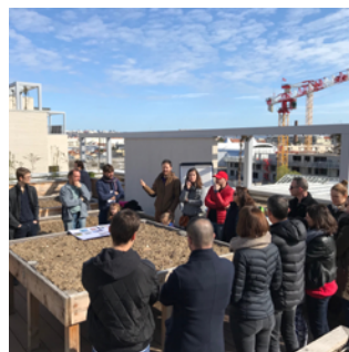
▲ Immeuble Néopolis 7-9-11 rue Hippolyte Kahn Architecte : l'Atelier Régis Gachon Architectes Promoteur : UTEI

La fin 2019 fut un grand moment dans l'histoire du projet Gratte-Ciel Centre-Ville : de nouveaux habitants y ont fait leurs premiers pas ! Néopolis est ainsi le premier immeuble de logements à sortir de terre. Il se compose de 53 appartements, d'une terrasse collective et d'un jardin potager spacieux et surélevé. Avec les beaux jours, séances de jardinage et apéros entre voisins rythmeront ses toits.