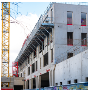
▲ Immeuble Prélude chantier en mars 2020 Maitrise d'ouvrage : Rhône Saône Habitant et Est Métropole Habitat Architecte : Michel Guthman Architecture & Urbanisme (MG-AU)

L'immeuble Prélude c'est aussi 67 logements sociaux décomposés en 2 bâtiments, en plein cœur de l'opération.